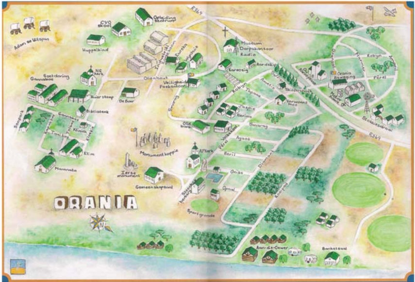
Figuur 5: Skets van Orania se dorpsgebied, 2022.