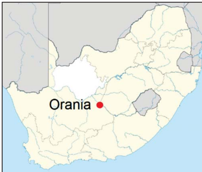
Figuur 1: Ligging van Orania aangedui op 'n kaart van Suid-Afrika. (Bron: Orania, https://af.wikipedia.org/wiki/L%C3%AAer:Orania_Kaart.png , besoek 2024-01-22.)

Orania is 'n groeiende dorp in die Noord-Kaapprovinsie van Suid-Afrika op die suidelike wal van die Oranjerivier. Die dorp is sowat 43 kilometer oos van Hopetown en ongeveer dieselfde afstand wes van die Vanderkloofdam. Die ligging van Orania word in Figuur 1 aangedui.